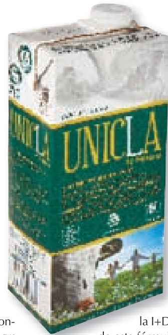
Imagen del envase del nuevo Unicla Premium.

Galicia tiene un sector lácteo que debe ser considerado estratégico para el futuro de la comunidad. Supone el 55% de la ganadería española, el 37% de la producción láctea de vacuno y el 29% de la capacidad industrial instalada. En el conjunto alimentario este sector es el más innovador y puede continuar generando valor a los ganaderos, a sus explotaciones y a la economía gallega, tanto desde el punto de vista demográfico y de conservación del territorio como de aportación al PIB. Sin embargo, las últimas adquisiciones de primeras marcas y activos industriales pueden facilitar que el precio de los excedentes europeos y otros productos de importación condicionen y determinen