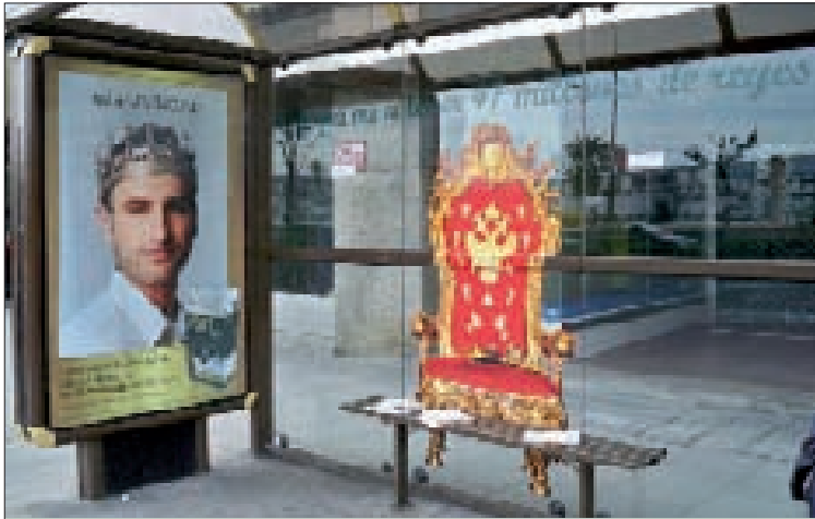
Imagen de una marquesina de la campaña del nuevo Unicla Premium.

En el microsite www.47millonesdereyes.com , creado expresamente para este cometido, los usuarios pueden recrear una coronación, hacer un “cursillo rápido de cómo ser rey”, con un código imaginativo e irreverente pero capaz de transmitir, en todo momento, el eje central de la campaña: “Unicla te ayuda a cuidarte como nadie”.