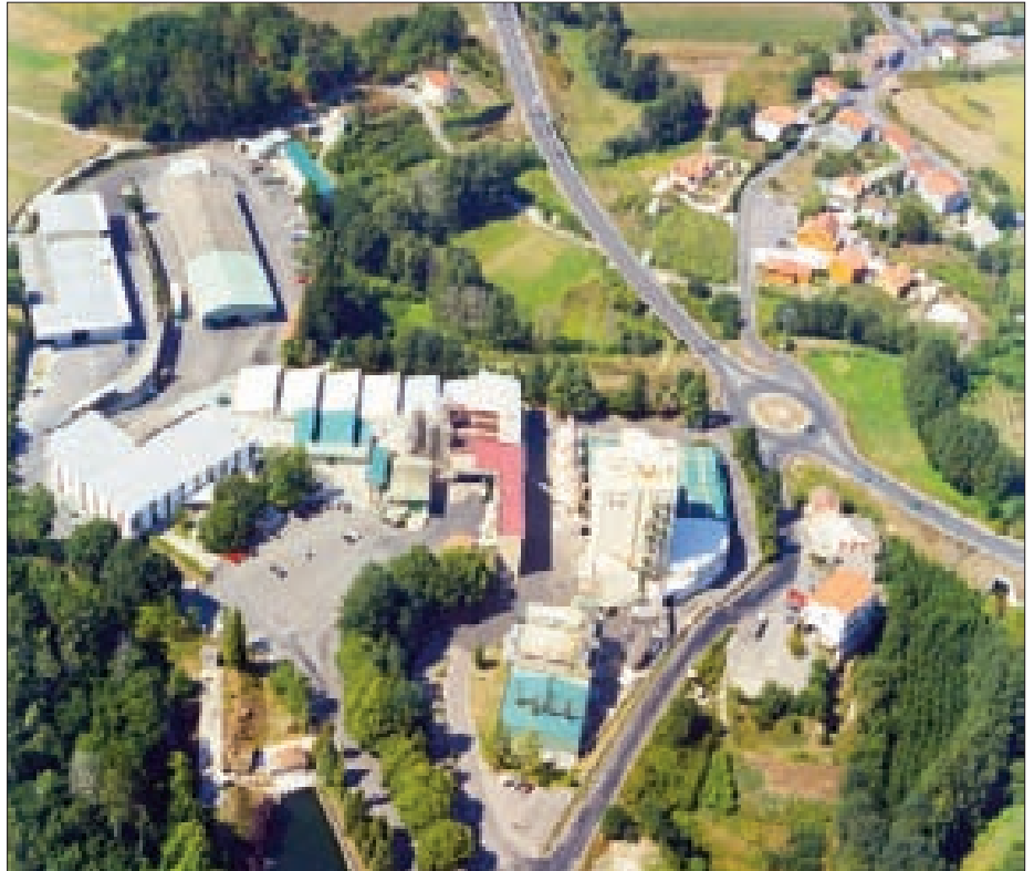
Vista aérea del complejo industrial de Feiraco en Pontemaceira, Ames, en el límite con Negreira.