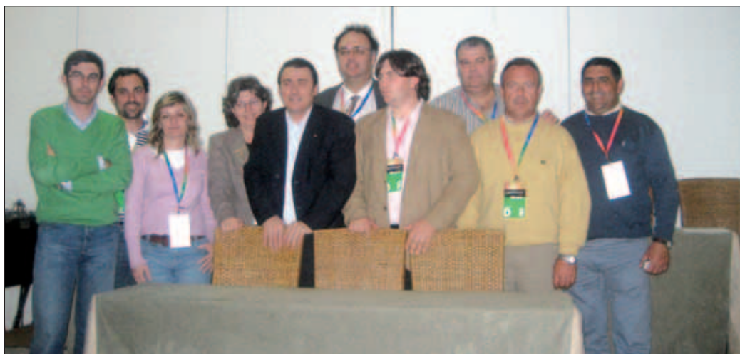
La nueva Comisión Ejecutiva de UPA Huelva con el secretario general de UPA Andalucía.