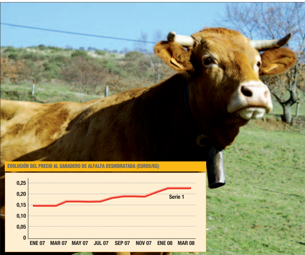
EVOLUCIÓN DEL PRECIO AL GANADERO DE ALFALFA DESHIDRATADA (EUROS/KG)

Nota: Datos en €/Kg vivo. El precio real percibido por los ganaderos no es el precio de lonja sino que los mataderos aplican descuentos.