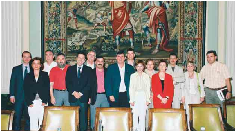
Primera reunión de la Comisión Ejecutiva Federal de UPA con Elena Espinosa.

UPA exige al Gobierno actual líneas firmes de actuación y apoyo, con presupuestos suficientes, para mantener la actividad económica de las explotaciones familiares agrarias, soporte fundamental para el mantenimiento del mundo rural, donde se concentran más de 13 millones de ciudadanos españoles en todo el territorio nacional.