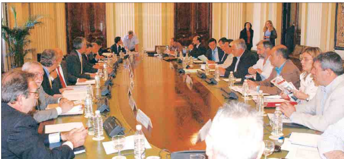
Reunión en el Ministerio de Agricultura para analizar las consecuencias de la sequía.

UPA defiende que las ayudas que se arbitren para compensar estas pérdidas deben ser orientadas a los sectores que se están viendo más afectados, moduladas y techadas como mecanismo de optimizar los recursos públicos.