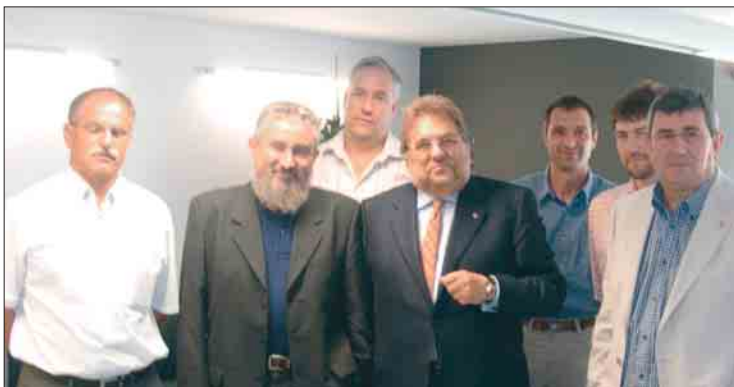
Los responsables de UPA y URAPAC-UPA con el conseller Siurana.