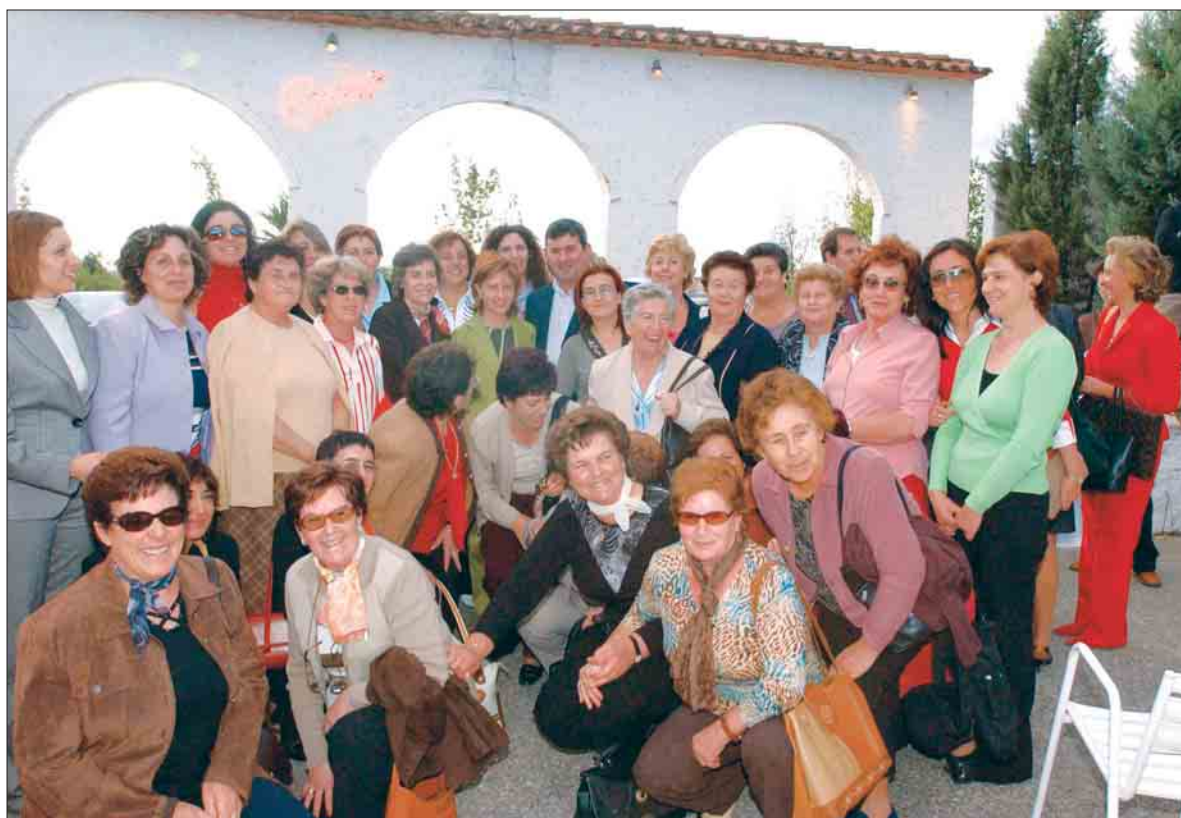
Acto de presentación de FADEMUR en Cáceres.

En este manifiesto se asegura, entre otras cosas, que "las mujeres rurales jugamos un papel fundamental en la seguridad alimentaria y en el desarrollo y la estabilidad de las áreas rurales. En España, somos casi 5 millones las mujeres que trabajamos y vivimos en el medio rural. Nuestro objetivo es sensibilizar a la sociedad y contar con el reconocimiento de nuestro trabajo, aunque con frecuencia sufrimos las consecuencias de la falta de igualdad".