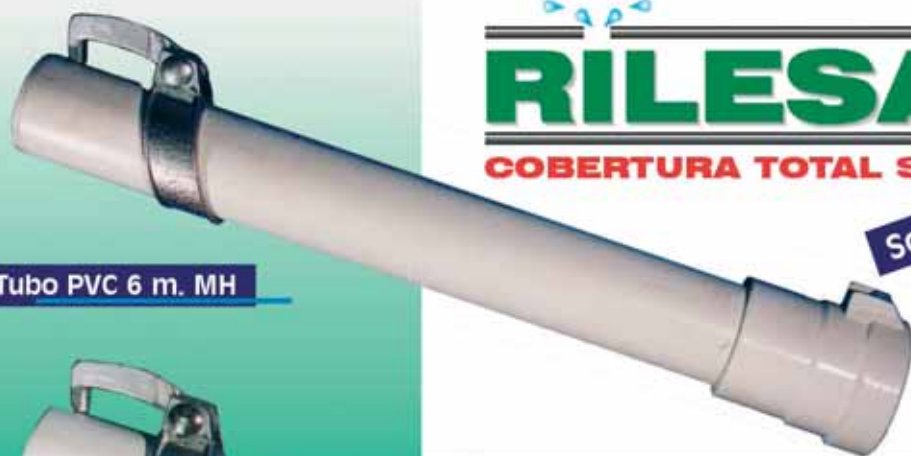
Tubo PVC 6 m. MH