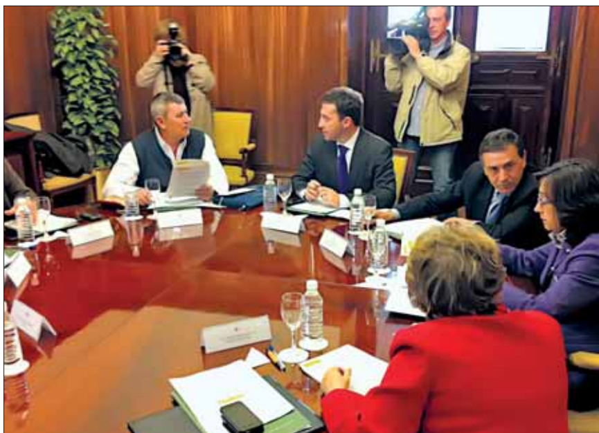
Negociaciones con el Gobierno.