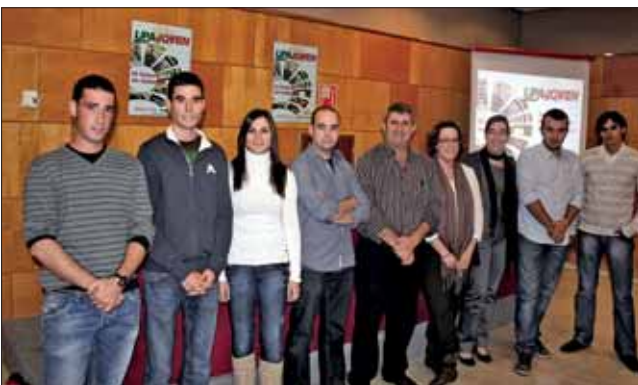
Acto de presentación de UPA Joven.