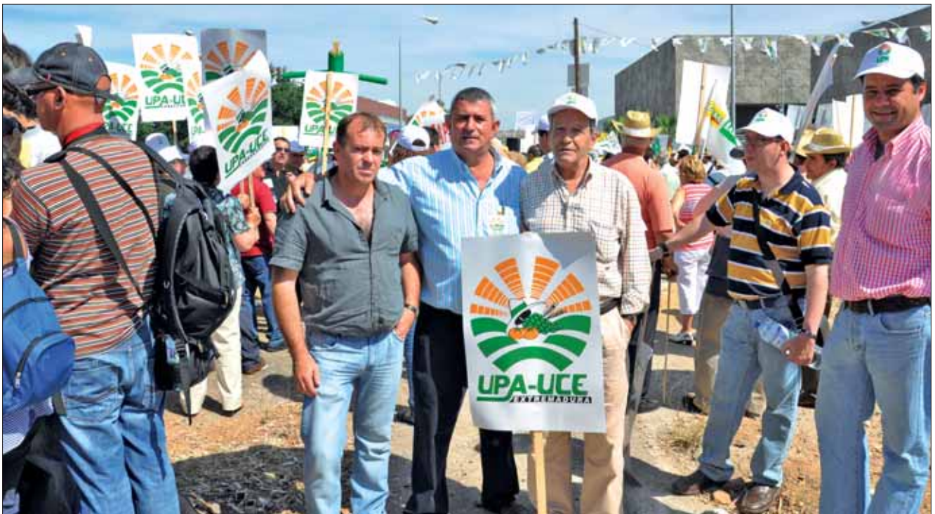
Junio de 2010. Manifestación en Mérida ante los ministros de Agricultura de la UE.

N os jugamos el futuro. En la Unión de Pequeños Agricultores y Ganaderos somos plenamente conscientes de que el proceso abierto en la Unión Europea para definir la “PAC más allá de 2013” será determinante para la actividad agrícola y ganadera, para el mundo rural y para la sociedad en general.