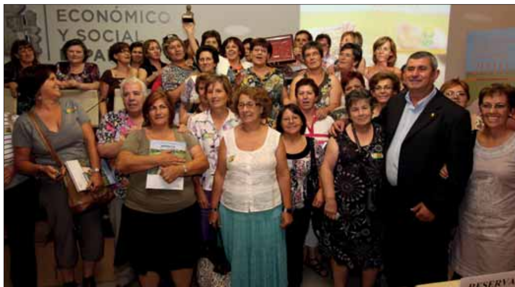
Asociación de Mujeres de Valdelacalzada.

Por su parte, la Asociación de Mujeres Kuria, de Valde-