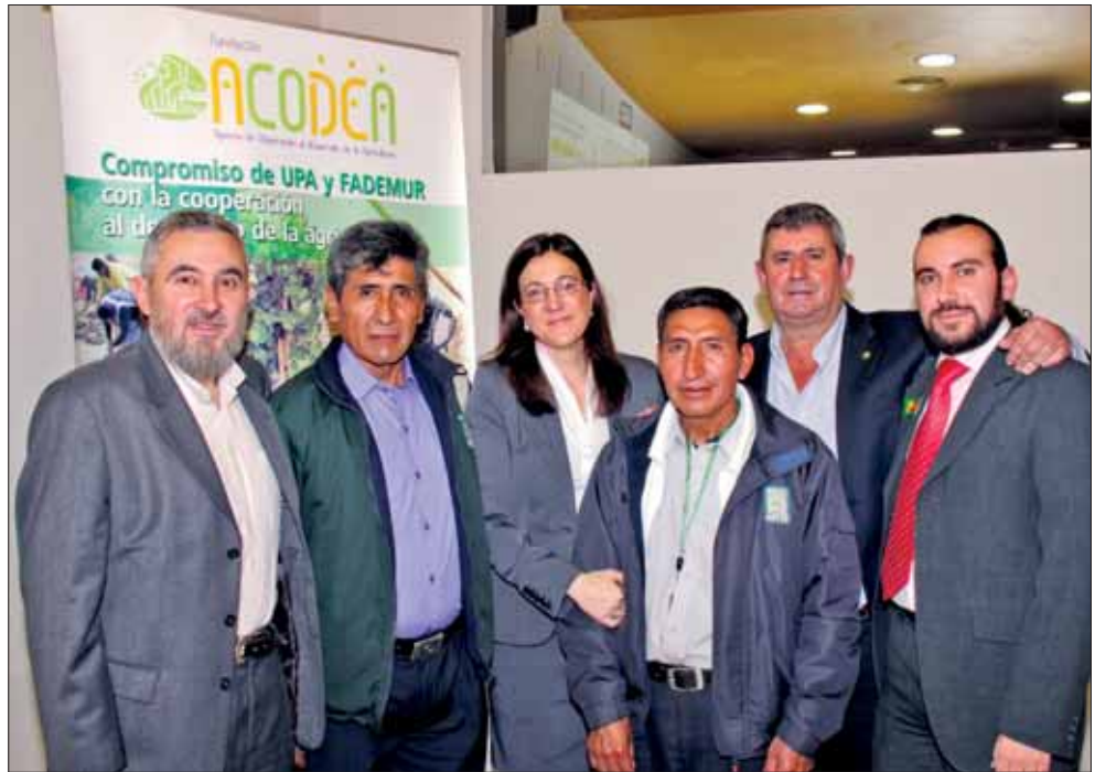
Acto de presentación de ACODEA en Madrid.

■ Contribuir al desarrollo agropecuario y medioambiental profesionalizado en los países en desarrollo para elevar las condiciones de vida profesionales y personales de las personas que viven y trabajan en el medio rural a través del planteamiento y puesta en práctica de alternativas y propuestas progresistas y de futuro a los problemas que ofrece el ámbito agrario y rural en dichos países tomando