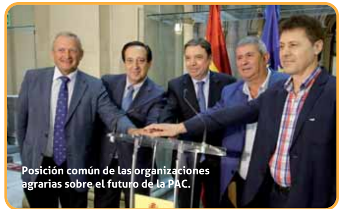
Posición común de las organizaciones agrarias sobre el futuro de la PAC.

El documento destaca el rechazo a las primeras propuestas marcadas por la Comisión Europea con recortes de la inversión destinada a la PAC del 4,5% en precios corrientes, destacando