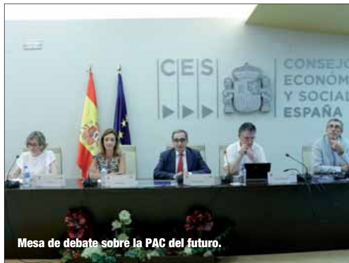
Mesa de debate sobre la PAC del futuro.

Ejecutivo español, al igual que muchos europeos, ha mostrado su rechazo, porque “la PAC no debe pagar el Brexit ”.