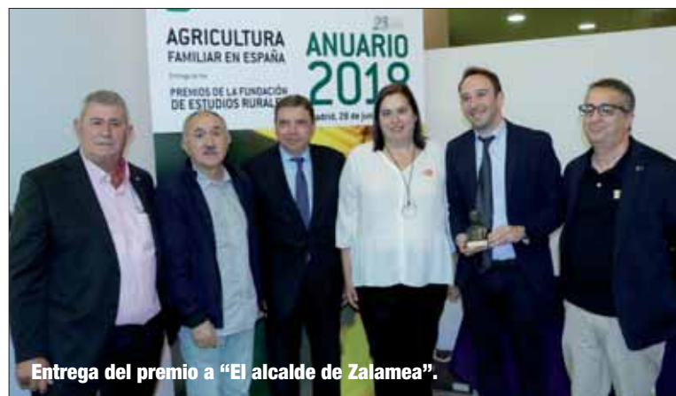
Entrega del premio a "El alcalde de Zalamea".

Investigaciones Científicas (CSIC) en el área de Ciencias Sociales, en reconocimiento a sus trabajos de investigación sobre acción colectiva y articulación de intereses en el sector agroalimentario, y