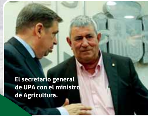
El secretario general de UPA con el ministro de Agricultura.