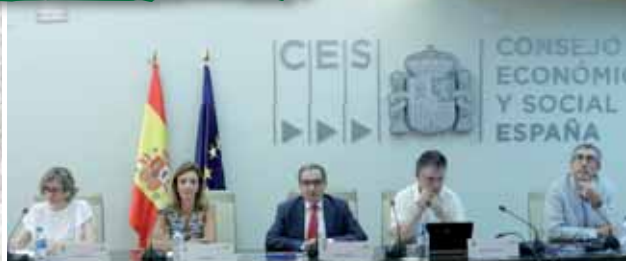
Debate sobre la PAC del futuro organizado por UPA.