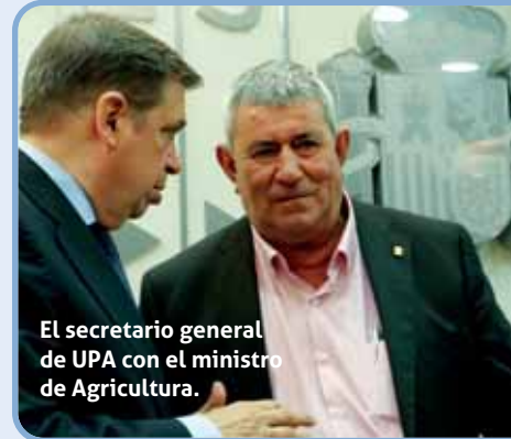
El secretario general de UPA con el ministro de Agricultura.

Con este mismo objetivo, UPA va a organizar una serie de jornadas sobre el futuro de la PAC por toda España, invitando a todas las Administraciones públicas, las instituciones y las organizaciones implicadas en este proceso. La primera de estas jornadas se celebrará en Madrid el 4 de octubre, con representación de la Unión Europea, el Gobierno español y las comunidades autónomas.