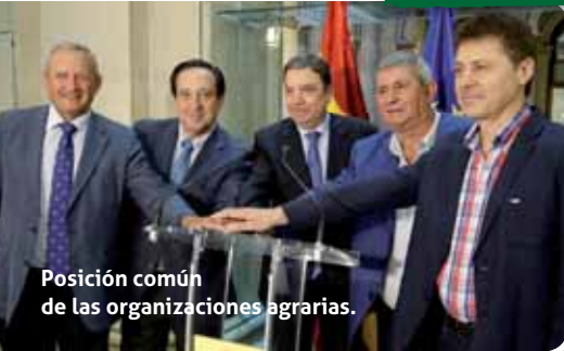
Posición común de las organizaciones agrarias.