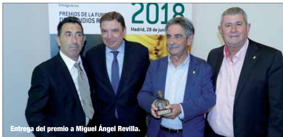
Entrega del premio a Miguel Ángel Revilla.