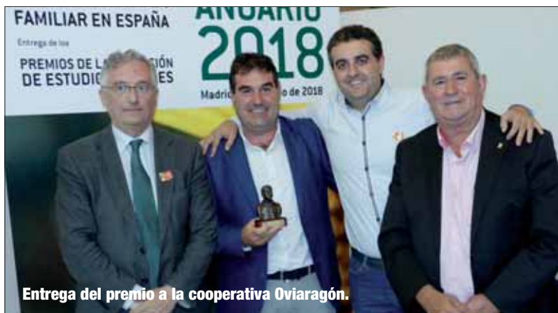
Entrega del premio a la cooperativa Oviaragón.