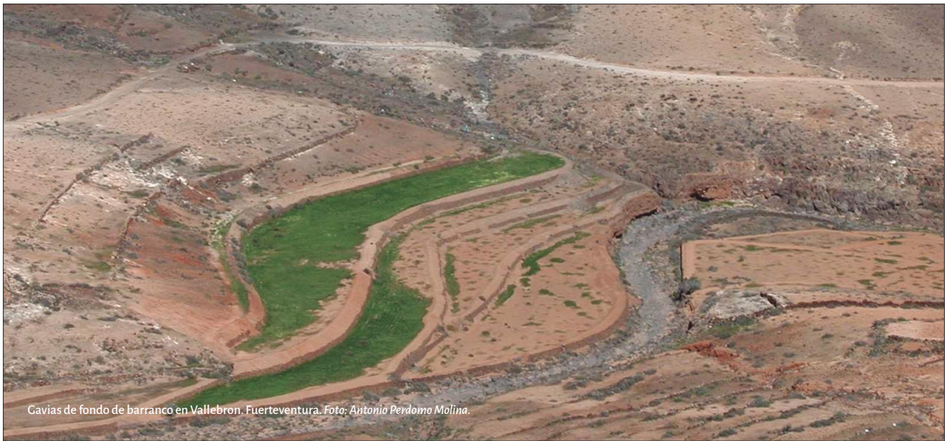
Cavias de fondo de barranco en Vallebrón. Fuerteventura.

Antonio Perdomo Molina 1 , Fernando Sabaté Bel 2 y Jaime Izquierdo Vallina 3 Universidad de La Laguna, Tenerife