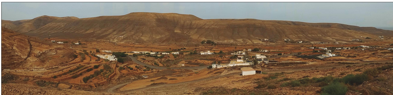
Valle Guisgüey, el valle de las mil gavias.

El núcleo central del modelo económico original de Fuerteventura desarrollado por los aborígenes majoreros era el pastoreo de ovejas y cabras, suplementado por un marisqueo de costa. Hoy en día no se sabe con certeza cómo, por qué, para qué y quién propició el poblamiento de las Islas Canarias. La única certeza sobre la que existe consenso científico a través de las investigaciones genéticas, similitudes lingüísticas y hallazgos arqueológicos es que el origen de los primeros pobladores se sitúa en el noroeste de África y en torno al cambio de era. Y todo parece indicar también que, al menos el contingente mayoritario, no llegó de forma voluntaria a las Islas, sino que fue trasladado de manera forzada