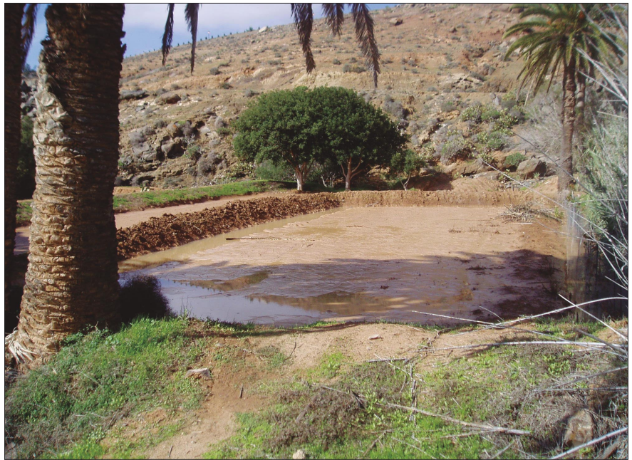
Cerramiento de tierra ( trastón ) de una gavia reforzado con vegetación.

■ Las compuertas . Son “estructuras de control del flujo del agua que se instalan en algunos caños de cierta importancia. Mediante la apertura y cierre de las mismas se consigue dirigir el agua hacia un grupo de gavias o hacia otro, así como evitar la entrada de más caudal cuando las gavias han