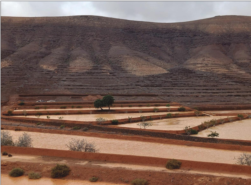
Gavias bebiendo después del paso de la tormenta tropical Hermine en 2022.

No se sabe con seguridad cuándo comenzó a desarrollarse el sistema de cultivo en gavias. En protocolos notariales de finales del siglo XVI no se habla de gavias sino de «vegas», lo que hace pensar que su introducción es más tardía. Se puede plantear, como primera hipótesis, que la génesis de las gavias se vincula a la llegada de esclavos capturados en Berbería, que no solo aportaron su fuerza de trabajo, sino, probablemente también, conocimientos, sistemas y modelos agrarios propios de sus desérticas regiones nativas del norte de África, cuya similitud con las particulares condiciones biogeográficas de Fuerteventura permitió adaptar tales saberes a la Isla