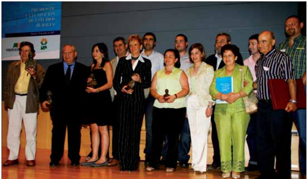
Foto de familia de todos los premiados, incluidos los ganadores del concurso de fotografía rural.