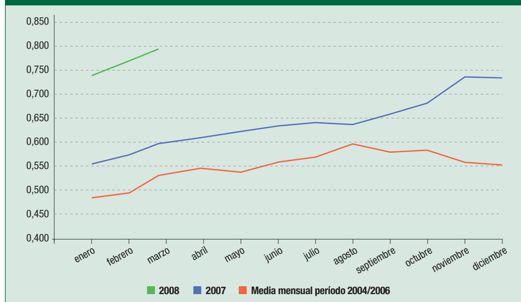
Gráfico 1 EVOLUCIÓN DEL PRECIO DEL GASÓLEO AGRÍCOLA

Por otro lado, el gas propano en el sector agrario es utilizado fundamentalmente por los propietarios de granjas avícolas y de invernaderos. Como se puede observar en el gráfico 2, el precio del gas propano ha sufrido un espectacular aumento desde el inicio de 2007, destacando de una manera espectacular la tenden-