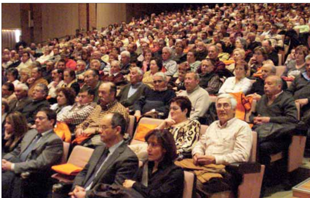
Día del Orgullo Rural organizado por UPA Aragón.

La campaña, que arrancó en diciembre de 2006 en Madrid, ha contado ya con actos muy emblemáticos, como los celebrados en Córdoba, Cantabria, Galicia –con más de 12.000 agricultores y ganaderos reunidos en Silleda en septiembre de 2007–, Almería, Zaragoza, etc.