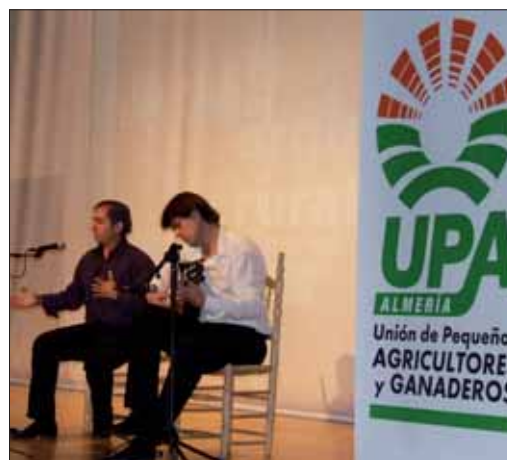
Día del Orgullo Rural organizado por UPA Almería.