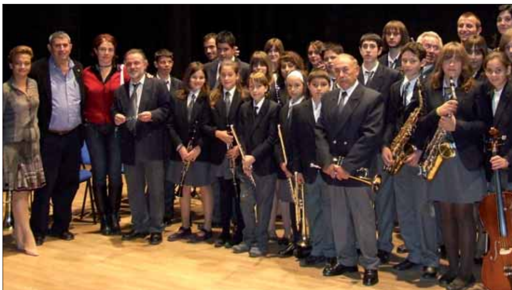
Día del Orgullo Rural organizado por UPA Almería.