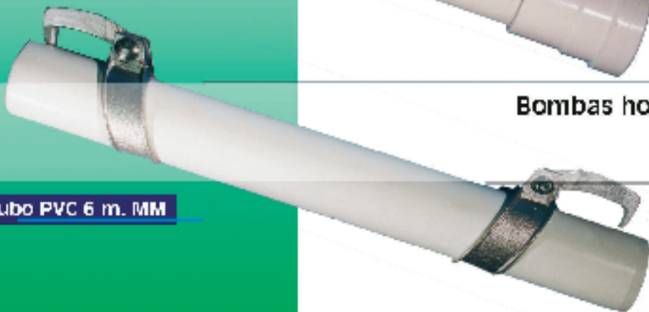
Tubo PVC 6 m. MM

Bombas horizontales, verticales y sumergidas Riego por aspersión y goteo Motores