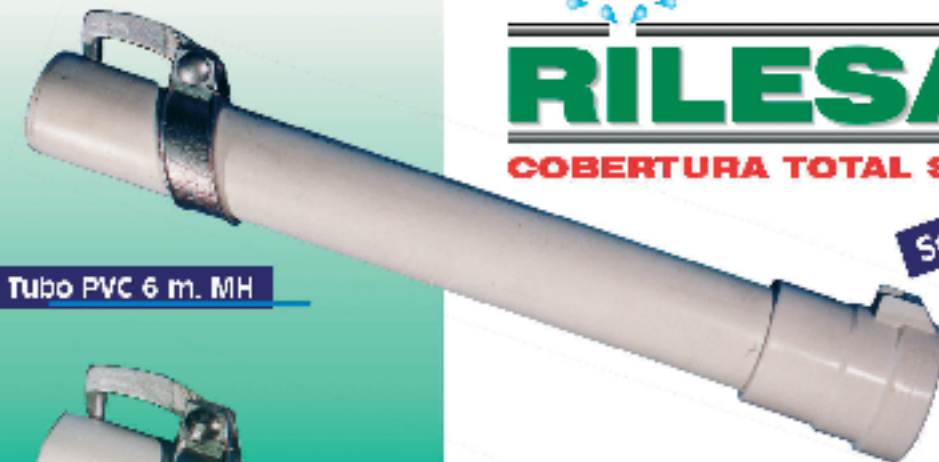
Tubo PVC 6 m. MH