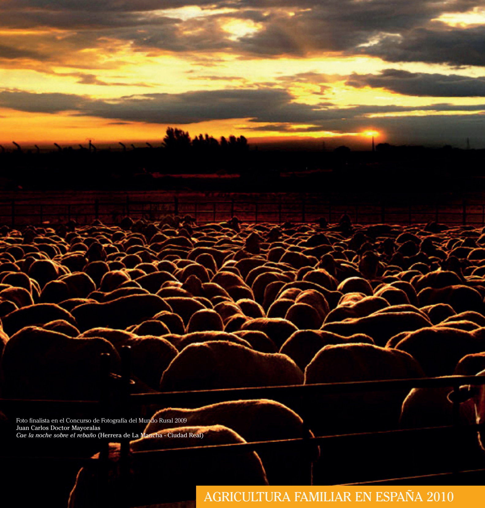
Foto finalista en el Concurso de Fotografía del Mundo Rural 2009 Juan Carlos Doctor Mayoralas Cae la noche sobre el rebaño (Herrera de La Mancha - Ciudad Real)