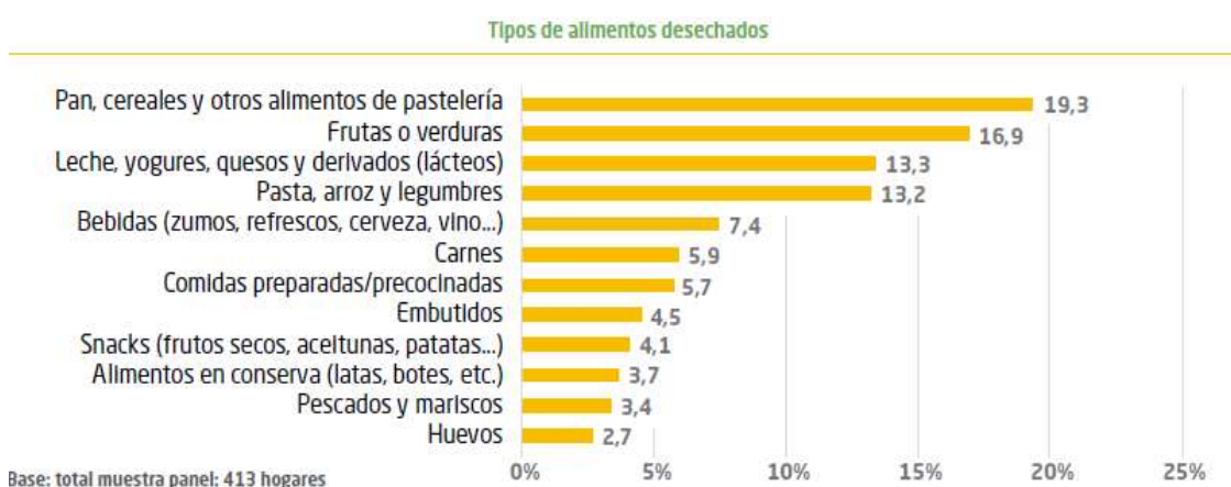
Gráfico 1 Estudio sobre el desperdicio de los alimentos en los hogares. HISPACOOOP (2012)

La Comisión Europea, estima que al año se desechan más de 1.300 millones de toneladas de alimentos, es decir, un tercio de la producción mundial, y que 89 millones de toneladas de alimentos en buen estado proceden de la Unión Europea.