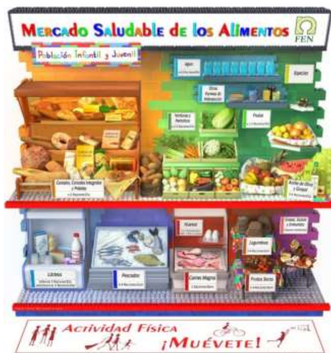
Imagen 4. Mercado Saludable de los Alimentos de la Fundación Española de la Nutrición

La mayor parte de las normativas y/o recomendaciones de comedores escolares a nivel de Comunidades Autónomas incluye una frecuencia de consumo de legumbres de al menos 1 a 2 raciones a la semana (teniendo en cuenta que una semana lectiva consta de 5 comidas).