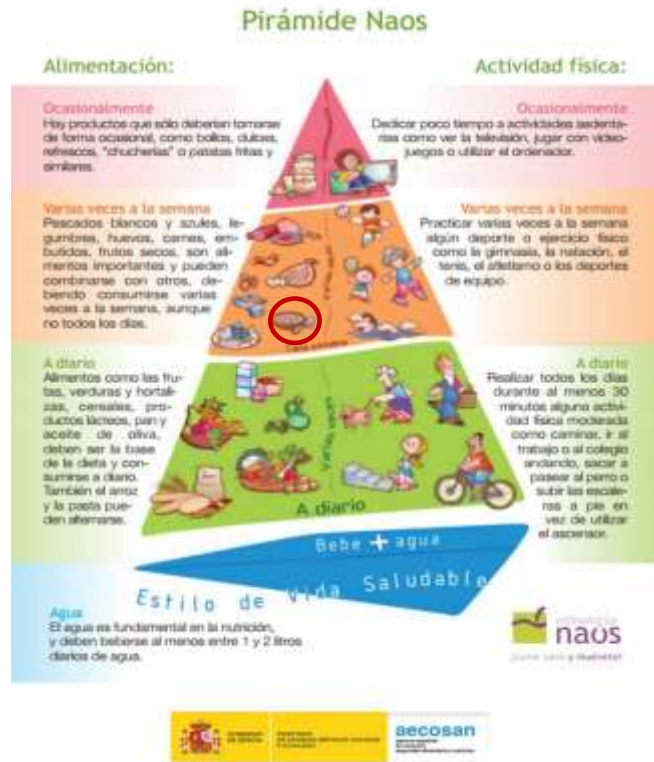
Imagen 2. Pirámide de la Estrategia NAOS de AECOSAN